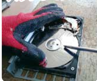
▲情報漏洩対策 ハードディスク傷付け作業