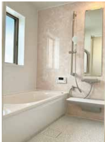
きれいなお風呂です