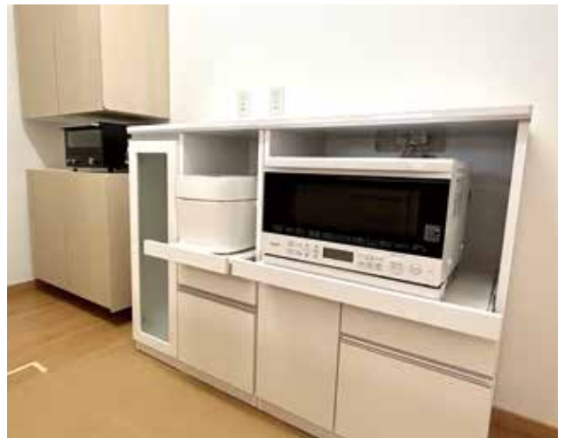
真柄福祉財団様より頂いたキッチン用品です

みなと寮は平成13年、佐渡島内で初の障がい者向けグループホームとして開所しました。当初は両津湊地区の旧本間歯科医院様を改築し、女性5人が地域での生活をスタートしました。みなと寮が開所して以来、今日まで島内の障がい者向けグループホームは順調に増えており、多くの方が支援を受けながら地域で生活しています。その中で、みなと寮は開所より昨年で21年が経過し、建物自体の老朽化、耐震への対応より障がいのある方に適した構造の必要から、建替することになりました。工事は昨年6月に開始し、今年2月に完成しました。その間、入居者の方には両津病院の旧医師住宅に仮住居を用意し、少々不便な生活を強いてしまいましたが、新しくなったみなと寮は、以前の二階建てから平屋に変わり、階段の上り下りに不便を感じることなく生活できるようになりました。そのほか、障がいがあっても暮らしやすい、最新の基準に沿った建物となり、入居者の方は今まで以上に快適に生活できるようになりました。今後もグループホームを障がいのある方の地域生活の入り口として捉え、地域の方々のご理解、ご協力を得ながら整備していきたいと考えています。 最後に、今回の建替工事にあたっては、新潟県様、佐渡市様、真柄福祉財団様より多大な補助をいただき実施することができました。この場を借りて感謝申し上げます。