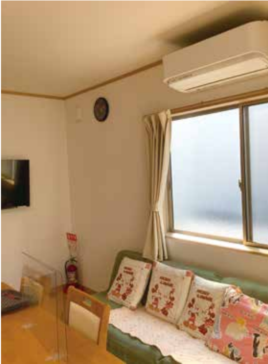
アットホームな ダイニングです