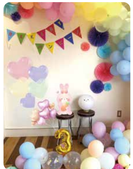
▲3周年のイベントでバルーン装飾した店内